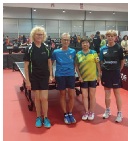
Harte Konkurrenz im Einzelwettbewerb