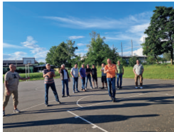
Sie wollen doch nur spielen ....