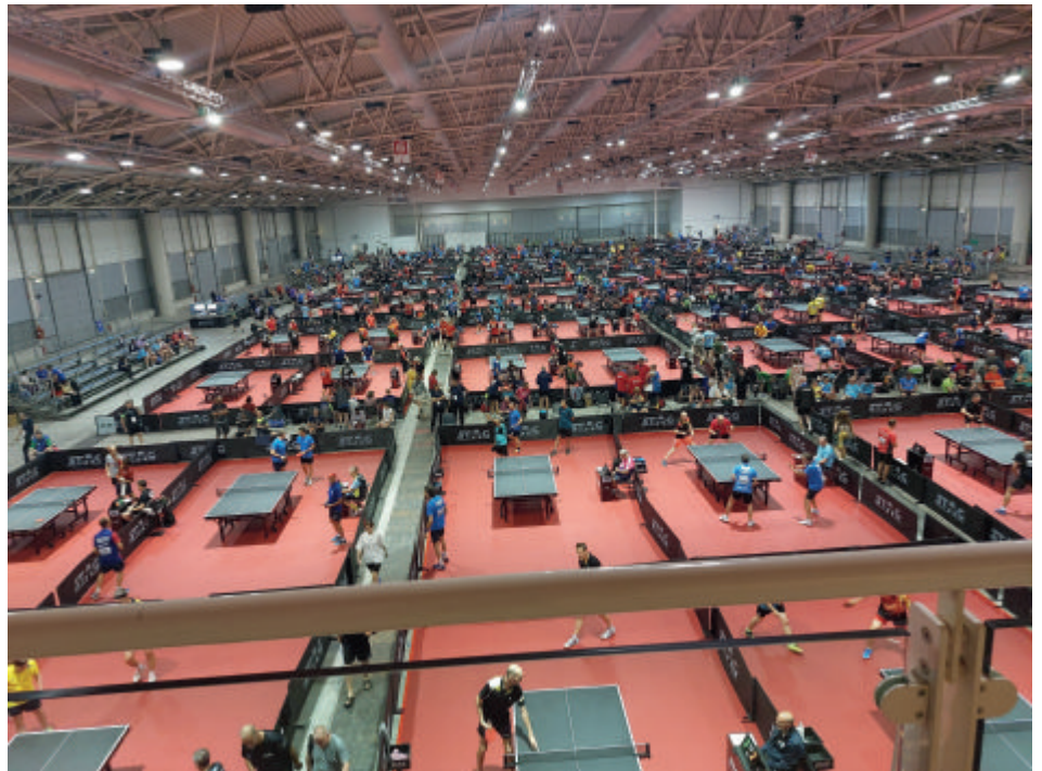
Eine ganze Messehalle in Rom nur für Tischtennis - ein wahnsinniges Erlebnis

96 Nationen waren durch die etwa 6.100 Tischtennis-Spielende vertreten, mit 1.200 Teilnehmenden aus Deutschland. Ein ganzes Messegelände wurde in der italienischen Hauptstadt nur für dieses Event genutzt, mit riesigen Sporthallen, in denen um die 100 Tische jeweils gestellt wurden. Dies hat natürlich eine enorme und gute Organisation erfordert. Im Tischtennis kann man schon ab 40 Jahren bei den Seniorinnen und Senioren spielen, und die Altersklassen werden in 5-Jahresschritten eingeteilt. Gespielt wur-