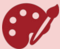
Hobby & Kunst