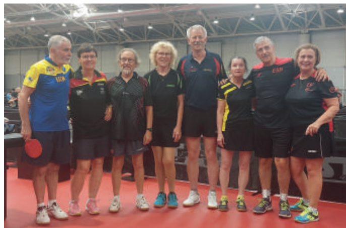
Teilnehmer im Mixed-Turnier

dass sie neben den Spielen auch Zeit hatten, sich Rom und Umgebung anzuschauen: Von den Stränden, über kulinarische Highlights und auch antiken Denkmälern wie das Colosseum. Jedoch mussten einige auch negative Erfahrungen machen, da Geldbörsen, Uhren, etc. geklaut oder Autos aufgebrochen wurden.