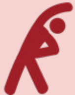
Fitness & Gymnastik