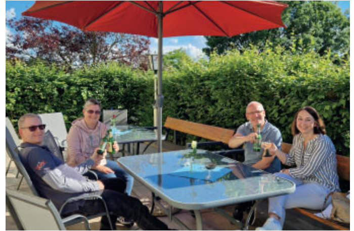
Während sich die einen abschaffen, damit alle Besucher zufrieden sind .... sitzen andere eher auf der Sonnenseite des Lebens !