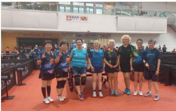
Nach dem Doppel-Turnier mit den siegreichen Japanerinnen links